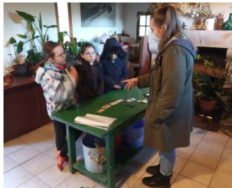
L'équipe des catéchètes d'Arles, Beaucaire-Tarascon et Avignon ne s'est pas laissée arrêter par les contraintes. Nous avons organisé un après-midi pour les enfants et les jeunes à Pomeyrol, profitant du grand espace du parc. Heureusement qu'il ne pleuvait pas, malgré une température assez basse.