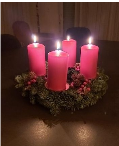
Travail minutieux par des mains expertes dans la joie comme le montre la photo du haut.