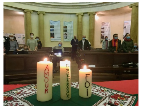
Suite à la page 4