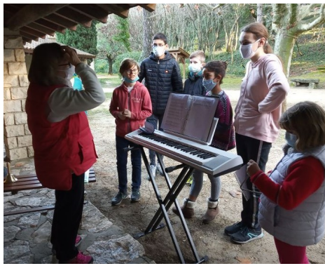
Après-midi à Pomeyrol le samedi 12 décembre 2020