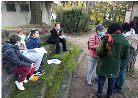
Le week-end complet à Pomeyrol n'a pas été possible, ni les fêtes de Noël à Arles et Beaucaire, prévues le 13 décembre.